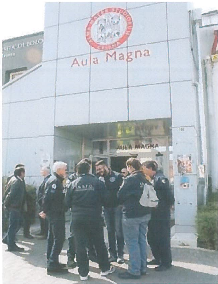
■ Formatori I.N.S.F.O. di fronte alla sede dell'Università di Cesena

«Oggi si utilizzano sempre più metodi attivi», continua Golizia, «ma non per questo la dimensione del fare prevale su quella del pensare. Al contrario, le metodologie attive, cioè: simulazioni e simulatori, role play, giochi didattici, project work aiutano a pensare meglio per poi fare meglio. Si riesce in questo modo a sviluppare una formazione progettuale, di taglio consulenziale, con project work individuali e collettivi finalizzati a proporre progetti concreti, idee di miglioramento, veri e propri laboratori di innovazione continua, creando così nuova visibilità e interesse per il momento formativo. Tutto ciò aumenta il numero dei corsisti perché invogliati dalle nuove metodologie e processi formativi, non più basati sull'ascolto ma "sul vedere e sul fare". Certamente il percorso formativo dei nuovi Disaster Manager dovrà essere sostenuto dal periodo operativo, ma per questo, purtroppo, ci saranno i momenti in cui si dovrà applicare la teoria alla pratica». Oggi, secondo Golizia, il Disaster Manager è il professionista delle attività di Protezione civile, perché